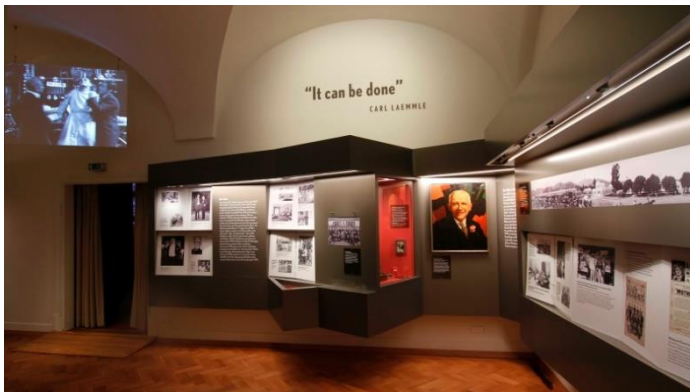
Carl Lämmle Abteilung

1724 siedelten sich mehrere jüdische Familien aus Illereichen und Buchau in Laupheim an. Als Judensiedlung entstand auf dem im Nordosten Laupheims gelegenen Judenberg ein vom Marktflecken abgesondertes nahezu rechteckiges Ghetto. In einem von der Herrschaft zur Verfügung gestellten Haus wurde ein erster Betsaal eingerichtet, im Nordosten der Siedlung ein jüdischer Friedhof angelegt. Seit 1771 gab es auf dem Judenberg eine Synagoge, die 1822 durch einen Neubau ersetzt wurde. Mitte des 19. Jahrhunderts war das jüdische Laupheim die größte jüdische Gemeinde im damaligen Königreich Württemberg. Im Zuge der Judenverfolgung während der Zeit des Nationalsozialismus wurde die Gemeinde ausgelöscht.